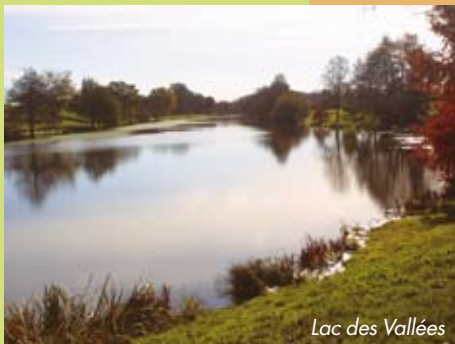
Lac des Vallées

Possibilité de pêche, aire de pique nique et parcours sportif.