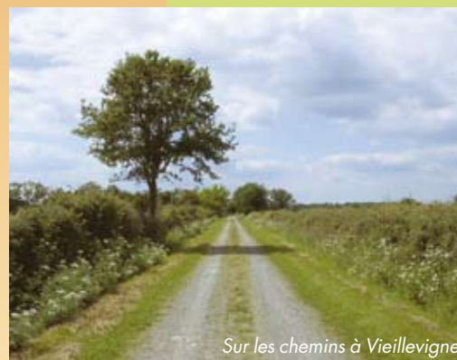
Sur les chemins à Vieillevigne

travers les fiefs de vignes. Un ancien pont de chemin de fer de l'ancienne ligne de Nantes à Rocheservière permet de traverser l'Issoire pour retourner jusqu'au point de départ après une éventuelle petite halte pour une visite de cave. Un circuit à découvrir à pied, à cheval ou à vélo.