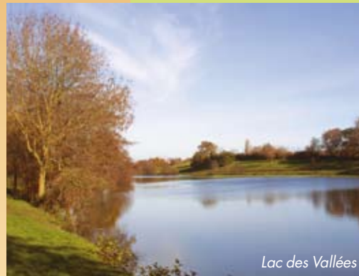
Lac des Vallées

le début du parcours pour laisser place par la suite aux champs cultivés et aux pâturages bordés de haies. Une agréable balade à faire à pied, à cheval ou à vélo pour découvrir les trésors cachés de la commune.