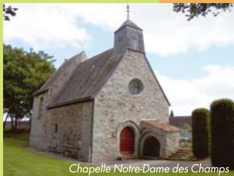
Chapelle Notre-Dame des Champs

(à Vieillevigne) Cette chapelle était autrefois appelée Bonne Fontaine car un puits se trouvait à l'entrée. Elle était également appelée Notre-Dame de Créelait car les femmes venaient y demander force et fécondité. Elle est située sur la route de Saint-Hilaire-de-Clisson.